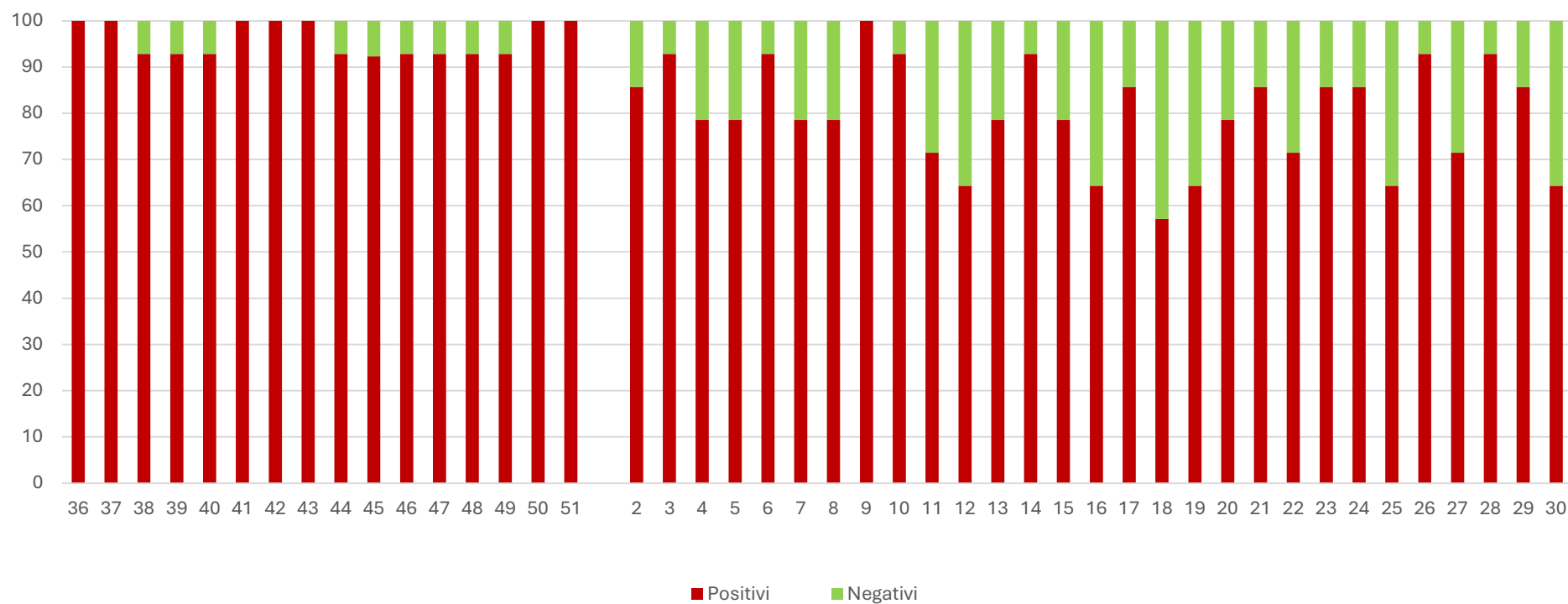
SARS-CoV2 (N1) %

I grafici seguenti mostrano i dati settimanali riportati in tabella 1 e in tabella 2, è presente un grafico per ogni virus monitorato: